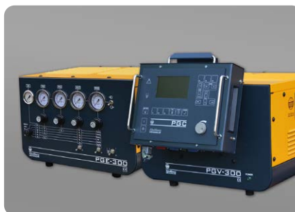
Gasversorgung manuell: PGE-300, automatisch: PGV-300 Gas supply manual: PGE-300, automated: PGV-300

Schneidgeschwindigkeit mm/min, Baustahl Cutting speed mm/min, mild steel