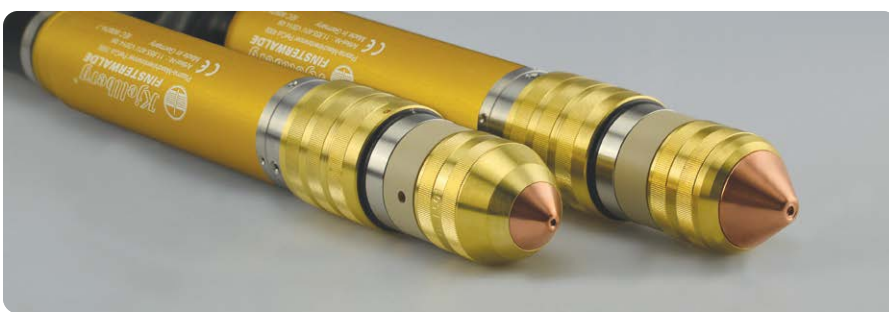
PerCut-Brenner: auch für Fasenschnitte bis 50° | PerCut torches: also for bevel cutting up to 50°

The torches PerCut 2000 and PerCut 4000 have been improved compared to the preceding models. They provide precise cuts and highest cutting speeds. Their unique cooling system up to the torch tip guarantees longest consumable life and reduces the gas consumption and costs per cutting metre.