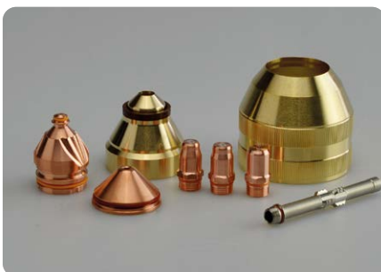
Verschleißteile mit langer Lebensdauer Consumables with long lifetime